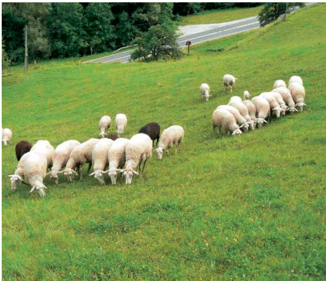
↑ Reja mlečnih ovc je bolj zahtevna od mesnih pasem.

z mesom jagnjet. Če si želimo z rejo ovc zagotoviti delovno mesto, je po ekonomskih izračunih potrebno rediti med 150 in 200 ovc, odvisno od intenzivnosti reje. Tudi odkup jagnjet za zakol ni najbolje urejen in so večji rejci vezani na lastno iskanje trga. Se pa povpraševanje po jagnjetini z ozaveščanjem kupcev povečuje, čeprav je njena poraba v Sloveniji še vedno precej nizka v primerjavi z drugimi evropskimi državami.