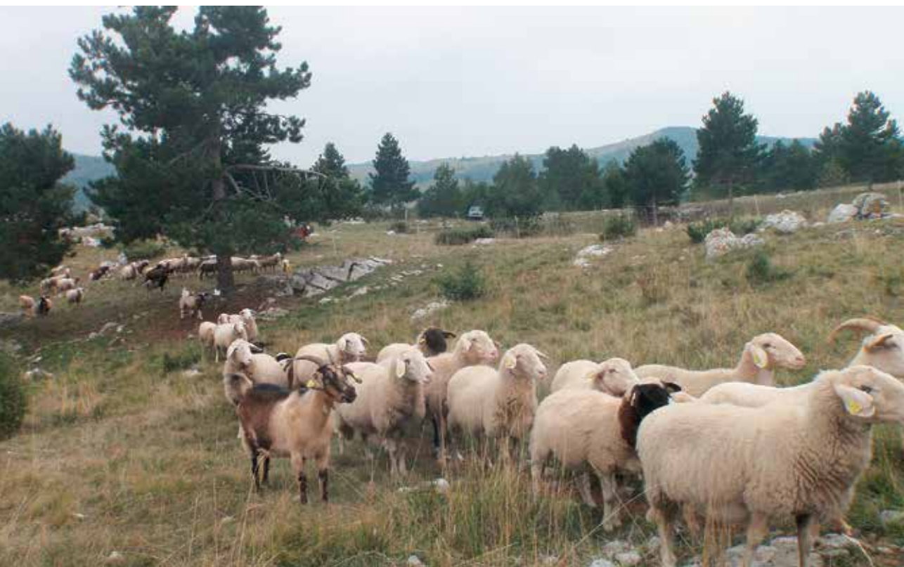
↑ Ovce in koze lahko pasemo na skupnem pašniku.